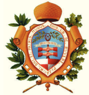
COMUNE DI PESARO